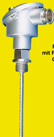
RT420-Einsatz mit Pt100-Fühler eines GTF103/RT420