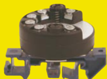
RT420 mit Schienenadapter

Bestellbeispiele: RT420 / WE, 4-Leiter, 0...50 °C RT420-SG / WE, 3-Leiter, -50...+150 °C