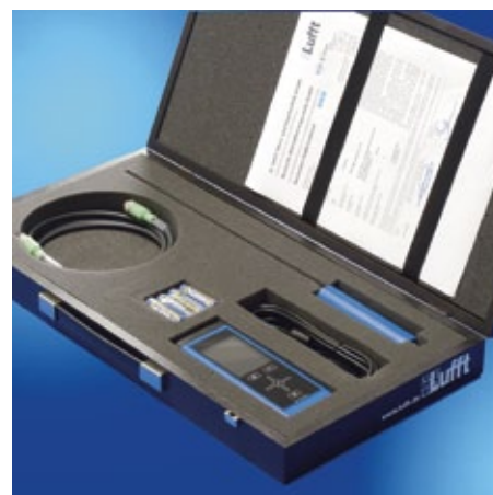
Hochwertiger Holzkoffer und PT100 Keramiksensoren im Lieferumfang enthalten.